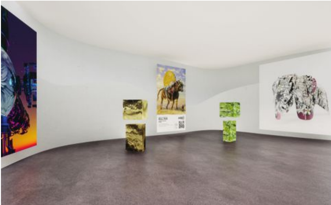
Nifrost.art er Nordens første heldigitale galleri for NFT-kunst. Mer og mer kultur konsumeres nå digitalt.